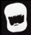
Ideazione e direzione artistica Gastone Pietrucci