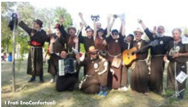
I Frati EnoConfortuali

"Da diversi anni il nostro Mondo sta cambiando rovinosamente e molti ritengono di essere alle soglie di un nuovo Medioevo. Quindi, come accadde nell'anno 1000, ecco che appaiono i "Giullari con il Saio" che raccontano cantando la propria storia popolare per le strade, le cantine e le piazze di ogni piccolo Borgo. Proprio a tal fine dieci anni fa sono nati "I Frati Eno-Confortuali" di Recanati; essi, colmi di questo spirito (nonché di quello del vino con cui confortano), vogliono onorare le tradizioni popolari insite nella nostra povera Italia. Una dozzina di pazzi e umili musicanti da questa componono il Convento itinerante di tali stornellatori da strada. L'esordio del gruppo risale al 2013 (dall'evoluzione naturale della band goliardica 'E Civette di Recanati) [...] Da allora ad oggi il loro impegno si è sempre più incentivato, tanto da rappresentare un particolare e coinvolgente stile di spettacolo da strada con l'utilizzo anche di strumenti bandistici [...]" (dalla presentazione di Marco Buccetti , ideatore e coordinatore del gruppo) E così questa piccola, pazza, indavolata e coloratissima bandella recanatese (tra l'altro sempre presente nelle Rassegne della Pasquella di Montecarotto e del Cantamaggio di Morro d'Alba) darà la sveglia a tutti i monsanesi, con il suo suono insistente, travolgente e buon augurante e concluderà il suo fracassoso tour, con l'ultima performance, nella Piazzetta Matteotti.